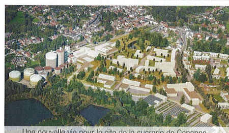
Une nouvelle vie pour le site de la sucrerie de Genappe...