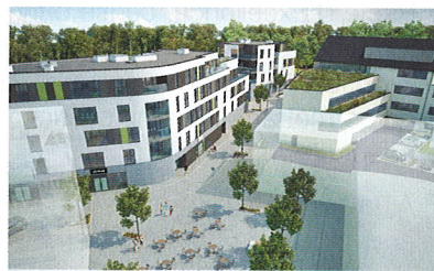
Jardins de la Pasture - Tournai