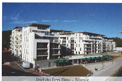
Port du Bon Dieu - Namur