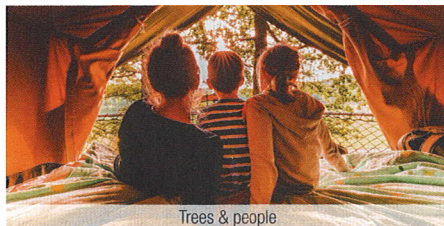
Trees & people