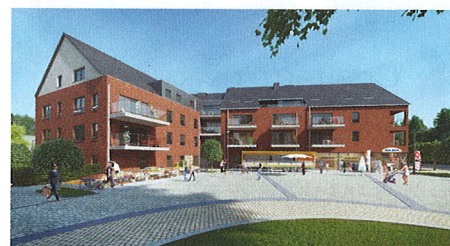
Jardin de l'Orne - Mont-Saint-Guibert