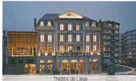
Théâtre de Liège