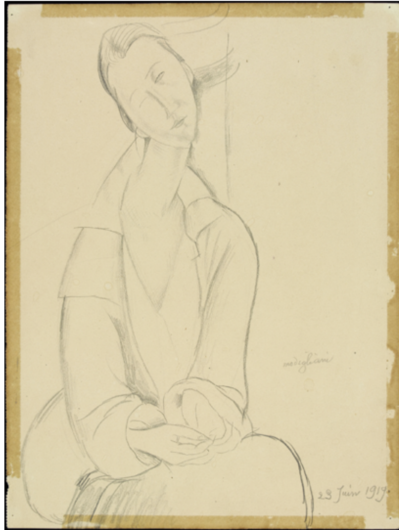
© Portrait de Lusia Czachowska, Amadeo Modigliani