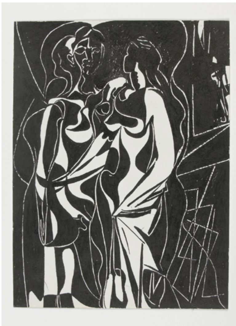
© Couple, 1926, Pablo Picasso © Succession Picasso 2019 - Photo © RMN-Grand Palais (Musée national Picasso-Paris) / Thierry Le Mage

15 000 femmes et 12 000 hommes) de 20 à 69 ans a été interrogé par téléphone. Afin de mieux faire le lien entre les catégories d'enquête et les qualifications pénales, il était demandé aux enquêtés ayant déclaré des violences sexuelles de décrire précisément les actes subis.