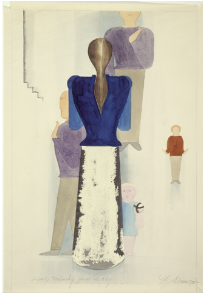
© Famille Oskar Schlemmer

Former toutes les sages-femmes de France à ce protocole de prévention est donc un objectif majeur, et mis en place progressivement sur le territoire. Un travail formidable est en cours en Alsace où le CHU de Strasbourg et les maternités œuvrent en synergie avec les sages-femmes libérales. Il y a environ 22 000 sages-femmes en activité en France, dont 20 % de libérales. L'objectif de SVS est que, d'ici cinq ans, toutes aient suivi la formation « Les bases de la connaissance en matière de violences sexuelles », jointe à deux formations spécifiques : périnatalité, sexologie. Ce cursus est axé sur la prévention, le dépistage et le soin des violences sexuelles. À date d'avril 2019, près de