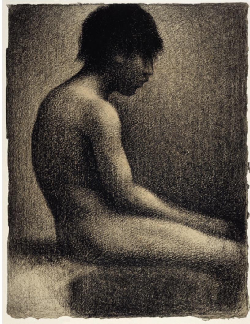
© M. assist. Etude pour « La Baignade », Georges Serrat – © Photo : National Galleries of Scotland, Dist. RMN-Grand Palais / Scottish National Gallery Photographic Department

► La médecine sexuelle est une offre de soins pertinente dans la prise en charge thérapeutique des violences sexuelles. Elle est désormais un maillon indispensable de la prévention secondaire et tertiaire de ces violences. Elle ouvre des dialogues avec les patients, libère leurs paroles sur la sexualité ou sur son développement dans ces contextes de violence. En créant un nouvel espace de soins individuels, ses objectifs sont le diagnostic, l'investigation et la prise en charge thérapeutique de troubles sexuels en complément des autres soins, psychiques et somatiques. L'apaisement favorisé par cette alliance thérapeutique vient faciliter le travail des autres personnels de santé et des autres champs souvent impliqués (social, justice, éducation).