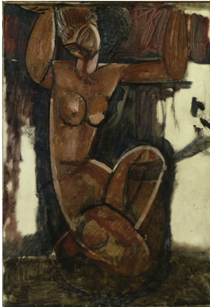
© Carabide, 1911-1912, Amedeo Modigliani

Ainsi, les programmes réputés efficaces doivent être complets, c'est-à-dire à composantes multiples, s'adressant aux principaux milieux qui ont une influence sur le développement et la perpétuation du/des comportements à prévenir. Toutefois,