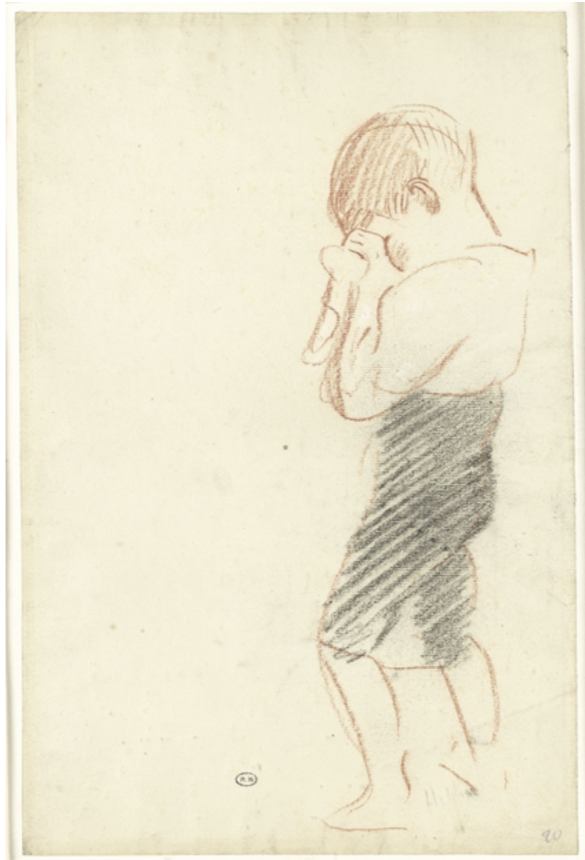
© Petit garçon pleurant, Paul César Hellen

L'équipe du centre médico-psychologique (CMP) s'est alors interrogée : Dans un objectif de prévention des maltraitances, y a-t-il des signes d'alerte annonciateurs d'une mise en