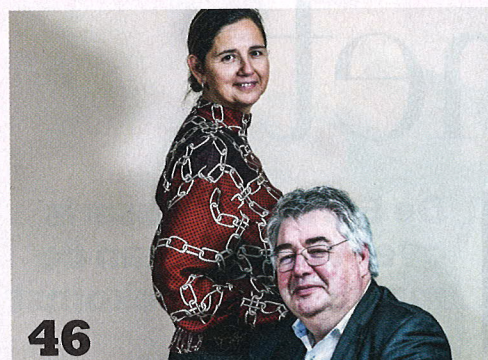
46 Vuyt & Wouters: De ex-N-VA'ers hekelen in een boek de macht van de partijvoorzitters: 'Een partij is géén familie.'