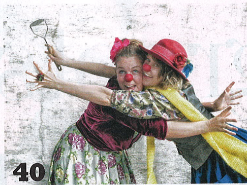
40 Clowns met een missie: Er verschijnen steeds meer zorgende clowns op het toneel. 'Wij gaan voor de glimlach, niet de schaterlach.'