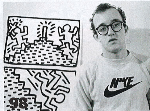
98 Keith Haring: In Bozar kunt u kennismaken met het militante oeuvre van het vroeggestorven popfenomeen.

'België heeft een van de hoogste productiviteitsratio's in Europa, en tegelijk de kortste loopbaan. Er is heus wel een verband.'