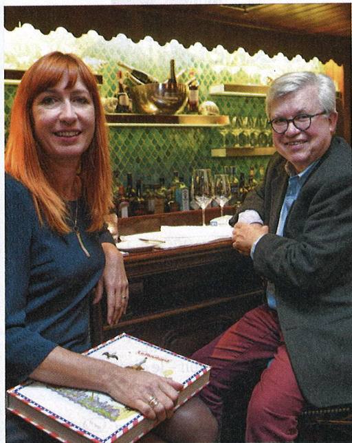
FREDERIC SIERAKOWSKI (ISOPIX)