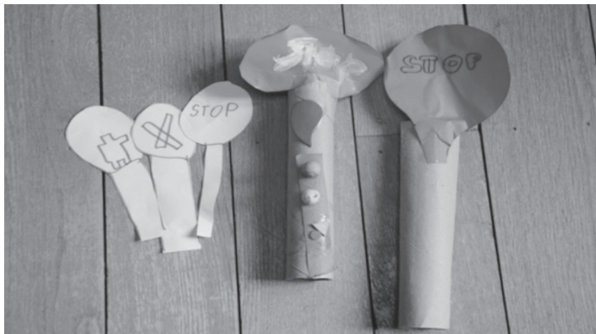
Figure 3 : Panneau stop de Louis

qu'il se sent démuné de ne pas savoir quel panneau utiliser pour se faire entendre. Le groupe lui renvoie que ses panneaux ne sont pas solides, qu'on ne voit pas le message stop. Nous lui proposons alors de les consolider. Il y ajoute un bâton à l'arrière.