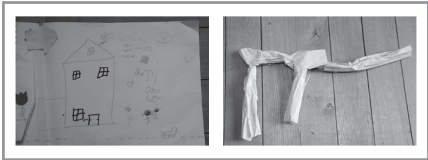
Figure 7 - Dessin de soi de Lucien, 11 ans.