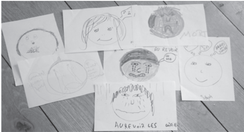
Figure 2 : Dessins de fin de séance réalisés par un groupe d'enfants - 2ème séance

faire part de certaines questions ou réflexions : Je me demande comment chacun va faire avec ces images difficiles dont on a parlé aujourd'hui. Je suis épatée par votre créativité et l'imagination que vous avez montrée durant cette séance, etc.