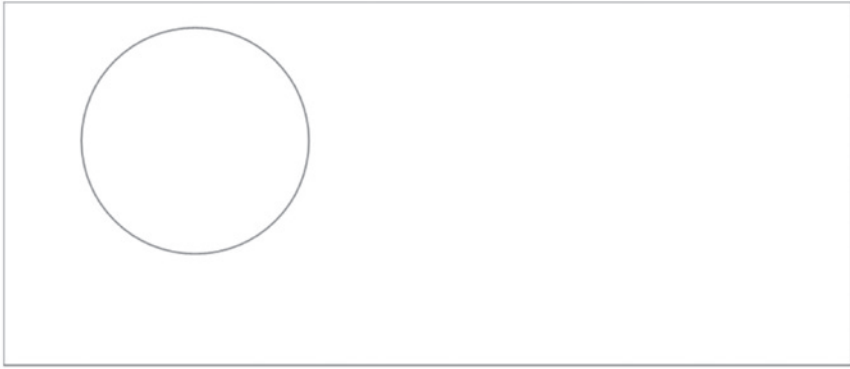
Figure 1 : Visage de fin de séance vierge

En tant que thérapeutes, nous réalisons également un visage de fin de séance, ce qui permet de renommer parfois certains moments qui ont été perçus comme plus angoissants ou plus éprouvants émotionnellement durant la séance. Cela nous permet également de