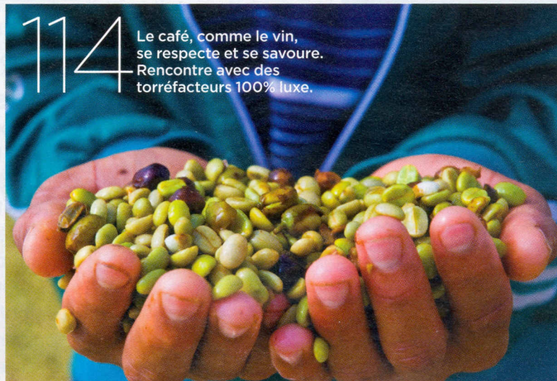
PHOTO COUVERTURE: PRAMODH RAMSURUN POUR MANAGEMENT; REMERCIEMENTS À AUGUST REGIS MAURITUS RESORT; PHOTOS SOMMAIRE: BRUNO CHAROY/PALSCO & CO; PHOTO: MAUREN BERTHÉ; ILLUSTRATION: ERIC GIRIAT; FOTOLIA; BRULERIE CARON; ILLUSTRATION: ERIC GIRIAT

Le café, comme le vin, se respecte et se savoure. Rencontre avec des torréfacteurs 100% luxe.