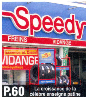
P.60 La croissance de la célèbre enseigne patine