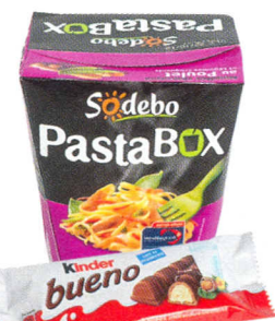
P.70 Le business du snacking explose