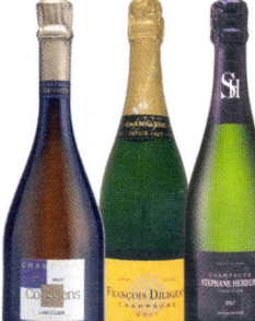
P.150 Vingt excellents champagnes