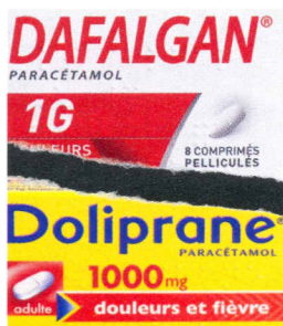
P.66 Le match sans merci des antidouleurs