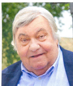
P.40 Louis Nicollin, intraitable en affaires