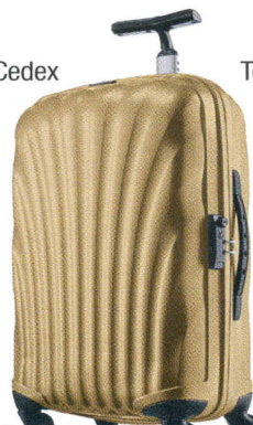
P.64 Samsonite résiste à la crise