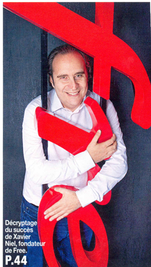
Décryptage du succès de Xavier Niel, fondateur de Free. P.44