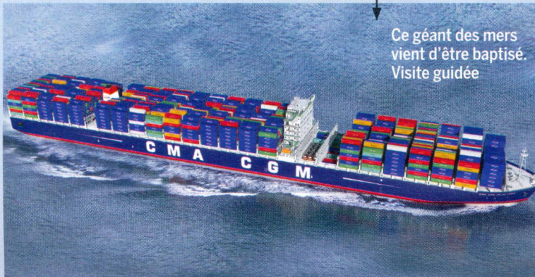
Ce géant des mers vient d'être baptisé. Visite guidée

Avant, ils visaient les domaines modestes. Désormais, ils convoitent nos plus beaux châteaux. Faisant grandir l'inquiétude.