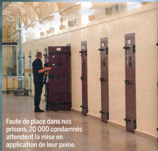
Faute de place dans nos prisons, 20 000 condamnés attendent la mise en application de leur peine.

22 Non monsieur le Président, les dépenses ne baisseront pas! Comme on pouvait le craindre, le plan d'économies «historique» annoncé par le gouvernement est surtout un gros coup de com.