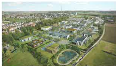
Parc d'activités économiques «Silver Economy» du BEP