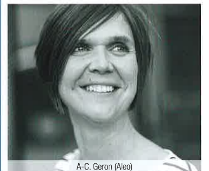
A-C. Geron (Aleo)

S'il y a bien un service de la CCI en phase avec le dossier thématique de cette édition, c'est assurément le programme de partage d'expériences Oxygène. Permettant aux dirigeants d'échanger chaque mois sur des problématiques inhérentes à leur fonction, il est perçu par nombre de participants comme un élément concourant directement à leur bien-être professionnel.