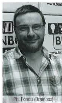
Ph. Fondu (Brainbox)