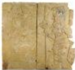
Papier de écorce, vers 1500-1600. Musée National d'Anthropologie, Mexico.

Sur les murs des temples de Mérida, les Mayas ont gravé des glyphes en pierre. Les Mayas ont gravé des glyphes en pierre. Les Mayas ont gravé des glyphes en pierre. Les Mayas ont gravé des glyphes en pierre. Les Mayas ont gravé des glyphes en pierre.