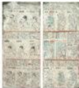
Papier de écorce, vers 1500-1600. Musée National d'Anthropologie, Mexico.

Déjà, les Mayas ont utilisé des feuilles de papier pour écrire. Les Mayas ont utilisé des feuilles de papier pour écrire. Les Mayas ont utilisé des feuilles de papier pour écrire. Les Mayas ont utilisé des feuilles de papier pour écrire. Les Mayas ont utilisé des feuilles de papier pour écrire.