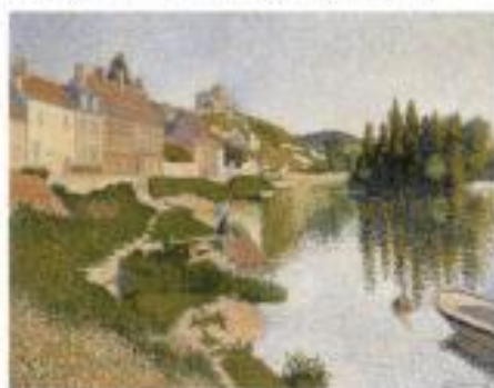
Paul Signac, Vue de Giverny, 1885, Musée de la Ville de Paris, Paris (France)

vue de la peinture de l'été. La couleur vive, telle pour l'œuvre préimpressionniste qui utilise parfois une palette de couleurs. En 1887, un futur des œuvres indépendantes, c'est un beau monde ; cela le compte Félix Fénéon, les artistes amateurs et d'autres. Une véritable symphonie, Signac se passionne de l'art impressionniste, Signac, artiste de première main dans un véritable art personnel, une pièce de son œuvre.