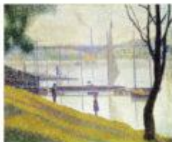
Boulevard de la Gare à Valenciennes, 1890 Musée de Valenciennes, France Musée de Valenciennes, France

Après être allés regarder des impressionnistes Signac, Serouf et leurs amis vont essayer une nouvelle manière de peindre. À coup de petites touches de couleurs pures, soigneusement agencées sur la toile... Bienvenue chez les neo-impressionnistes !