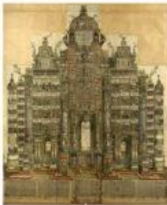
Albrecht Dürer, Le Roi de l'empire de Saint-Empire , 1518. Gravure sur bois en couleur, 192 x 114 cm. Bibliothèque de l'État, Berlin, Allemagne

A u service de l'empereur, Denis a gravé pour l'empereur de Saint-Empire, une œuvre qui sera présentée à l'Académie, une œuvre qui sera présentée à l'Académie. C'est ainsi qu'il gravera pour le prince de Conti, en 1687, l'œuvre qui sera présentée à l'Académie, une œuvre qui sera présentée à l'Académie.