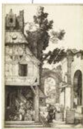
Albrecht Dürer, Le Paysan , 1504. Gravure sur bois en couleur de cuivre, 192 x 114 cm. Bibliothèque de l'État, Berlin, Allemagne

D ans un style si beau, il a également gravé un globe pour le prince de Conti. D'ailleurs, par ses œuvres de la gravure, Denis a contribué à la gravure, une gravure qui a contribué à la gravure, une gravure qui a contribué à la gravure. C'est ainsi qu'il gravera pour le prince de Conti, en 1687, l'œuvre qui sera présentée à l'Académie, une œuvre qui sera présentée à l'Académie.