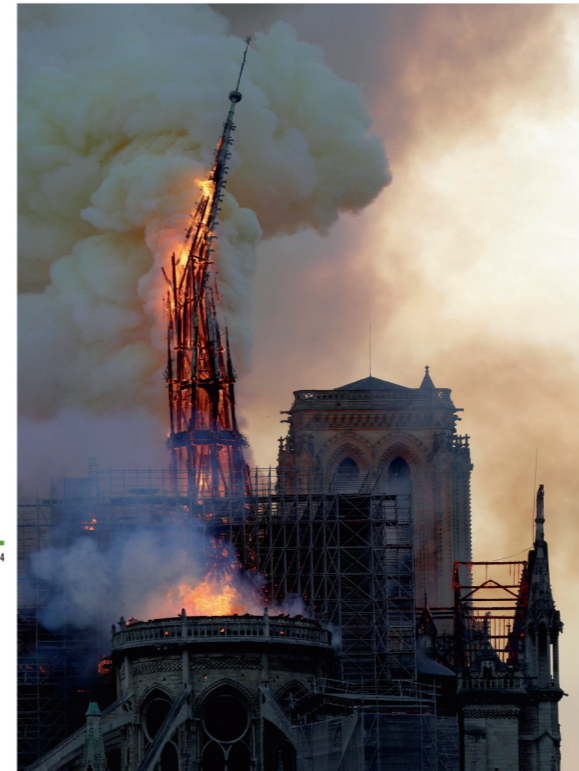
Incendie de Notre-Dame de Paris, 2019. L'incendie qui a ravagé les toits de Notre-Dame de Paris, le 15 avril 2019, entraînant la chute de la flèche, a suscité une émotion à la mesure de ce bâtiment religieux devenu, au fil des siècles, un lieu de mémoire et, à travers le nom de Victor Hugo, un véritable mythe national. En même temps qu'il suscitait un formidable élan de solidarité, il a conduit à repenser la question du patrimoine.

LE MONDE D'AUJOURD'HUI. Un état des lieux géopolitique de chaque pays de la planète, sous forme de fiches signalétiques