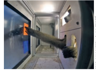
2019, AIX-MARSEILLE UNIVERSITÉ

66 ÉTHOLOGIE Bébé chauve-souris apprend à voler avec maman