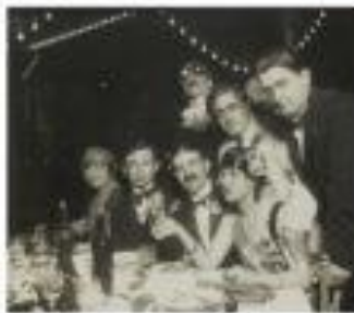
Francis Picabia au milieu d'un groupe d'artistes, vers 1912.