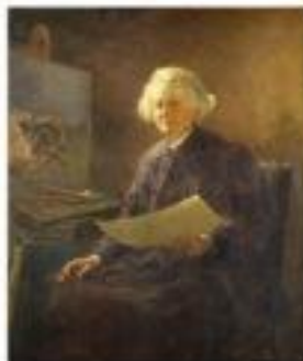
Rosa Bonheur, Rosa Bonheur , 1896. Huile sur toile, 112 x 91 cm. New York, The Met Museum

TRÈS CÉLÈBRE DE SON VIVANT EN FRANCE COMME DANS LE MONDE, ROSA BONHEUR TOMBE PEU À PEU DANS L'OMBRE APRÈS SON DÉCÈS. EXCEPTION SAUVE DE QUELQUES FEMMES, QUI L'EMPLOIENT À ENFANTER LA MÉMOIRE ET À CULTIVER, COMME ELLE, UN GOÛT POUR LA LIBERTÉ.