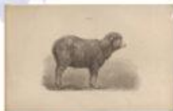
Étude de Rosa Bonheur, d'après Rosa Bonheur, 1809. Huile sur toile, 112 x 91 cm. New York, The Met Museum