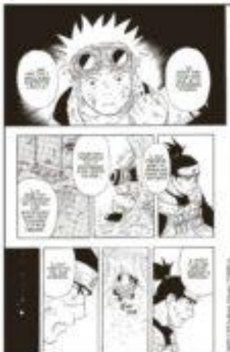
Shounen Naruto , chapitre 1000-1001. Scène d'un combat de la série Naruto de Masashi Kishimoto.