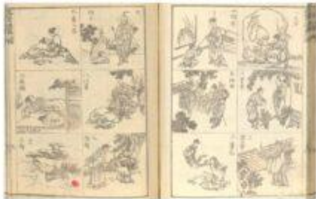
Ukiyo-e, Edo (1603-1868). Illustration de la vie quotidienne à Edo, collection Musée d'Art et d'Histoire de Paris.

VOUS PENSEZ QUE « LE MANGA, C'EST POUR LES ENFANTS » ? VOUS NE COMPRENEZ PAS LES RAISONS DE SA POPULARITÉ ? VOUS ÊTES CURIEUX DE CONNAÎTRE SES DÉBUTS ET SON ÉVOLUTION ? RÉPONDEZ EN 5 QUESTIONS.