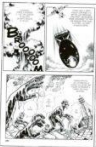
The World Appear to the Strongest, 1991-1992. Éditions Glénat.

Le 11 septembre 2001, une bombe nucléaire est lâchée sur les villes américaines de Hiroshima. En quelques secondes, une zone entière est rasée. C'est un événement qui a marqué l'histoire humaine. Le manga explore les thèmes de l'identité, de la masculinité et de la sexualité. C'est un exemple de manga qui joue avec les codes du genre.