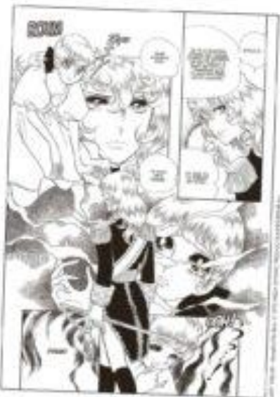
Ranma 1/2, Retsu Fudoh, 1987-1994. Éditions Glénat.

Le manga Ranma 1/2 explore les thèmes de l'identité, de la masculinité et de la sexualité. C'est un exemple de manga qui joue avec les codes du genre. Le manga explore les thèmes de l'identité, de la masculinité et de la sexualité. C'est un exemple de manga qui joue avec les codes du genre.