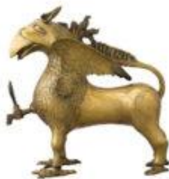
Statue de bronze : Griffon ailé, vers 1316. Paris, Musée du Louvre