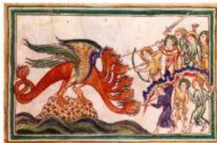
Extrait de la Bible, Apocalypse (livre des prophéties), vers 1316. Paris, Bibliothèque nationale de France

Le dragon est un animal qui se trouve à partir du Moyen Âge. On reconnaît aisément l'animal et son corps de lion. C'est à cette époque que le griffon se répandit en Europe. C'est à cette époque que le griffon se répandit en Europe.