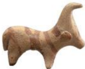
Animal à une corne, vers 14000-13500 av. J.-C. Terre cuite et argile rouge, 4,6 cm. British Museum of Natural History

Cette petite figurine en terre cuite a plus de 5 000 ans ! Révélée en 1958, elle est l'une des plus anciennes représentations de licorne connues des historiens de l'art. C'est la preuve de la civilisation d'Épipaléolithique, que l'on voit apparaître en premières représentations d'art rupestre d'une telle variété que le faon, le cerf, le bouquetin, le bœuf, le cheval, le chien, le chat, le porc, le poisson... On trouve tout ce que la nature offre à l'homme, et cela, comme on peut le constater, au sein de cultures très diverses.