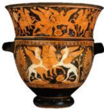
Griffin, vers 170-180 avant J.-C. Ailes, 41,8 x 42,4 x 42,4 cm Paris, Musée du Louvre

C 'est au Proche-Orient que le griffon fit son apparition dès le IV e millénaire avant J.-C. Inconnu, à cette époque, par les Grecs, il devint connu par les Romains à la suite de la conquête de l'Asie Mineure. On le représentait alors comme un animal à tête de lion et à queue de dragon. C'est à l'époque des croisades que le griffon se répandit en Europe. C'est à cette époque que le griffon se répandit en Europe. C'est à cette époque que le griffon se répandit en Europe.