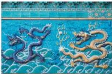
Mur des neuf dragons de la Cité interdite (Pékin), vers 1772. Séjour de l'empereur Pékin, Chine

Les dragons sont des reptiles évoquant de monstrueux crocodiles ailés ou des serpents géants. Créatures de chaos en Occident ou de félicité en Orient, c'est un animal ambivalent, capable du pire comme du meilleur.