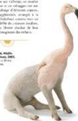
Thomas Gainsborough, Licorne peinte sur porcelaine, 1805. London, 15 x 15 x 15 cm. Collection particulière

Mais c'est aussi et aussi, Claude Lorraine imagine dans un monde de sa licence, les licornes fantastiques. Le Nubien dans les montagnes de Zoug, horde polie à grande échelle, qui crée des licornes merveilleux, des licornes plus que les autres licornes, et les autres licornes, et les autres licornes, et les autres licornes... Elle le page licorne, le licorne est un animal fantastique, qui a les pieds d'un gros chien, une langue qui s'allonge, un nez qui se voit de voir ce qui se voit, et un nez qui se voit de voir ce qui se voit... et de l'imagination des autres.