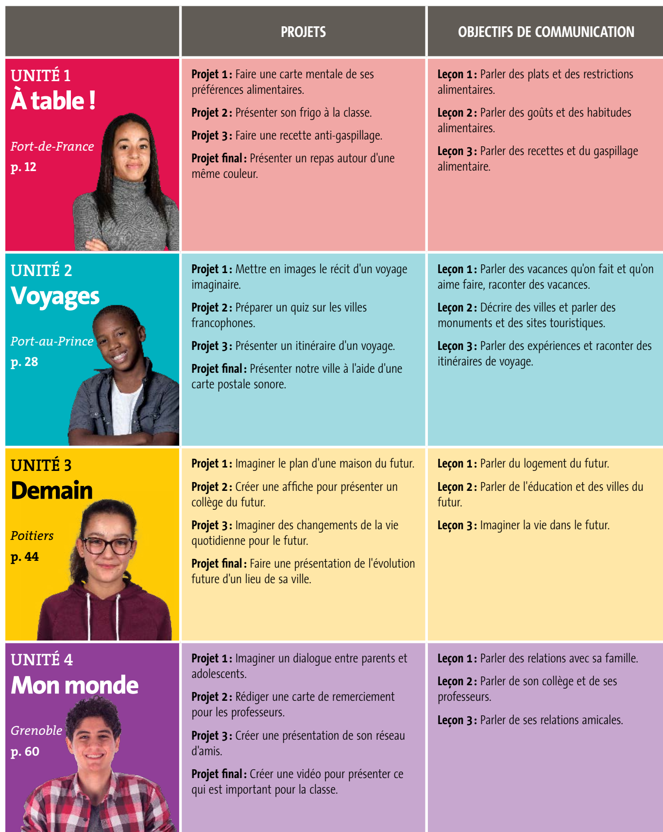
Tableau des contenus