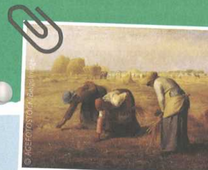
MILLET Jean-François, Des glaneuses , 1857, huile sur toile, 83,5 x 111 cm, Musée d'Orsay, Paris.