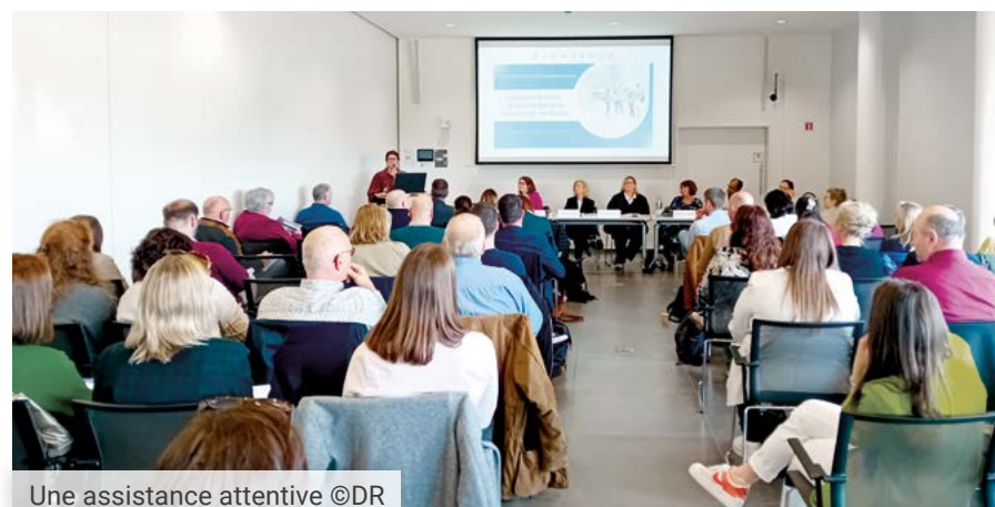
Une assistance attentive

Ces différentes interventions ont permis aux participants d'appréhender rapidement certaines des questions qui se posent dans les établissements scolaires. Souli-