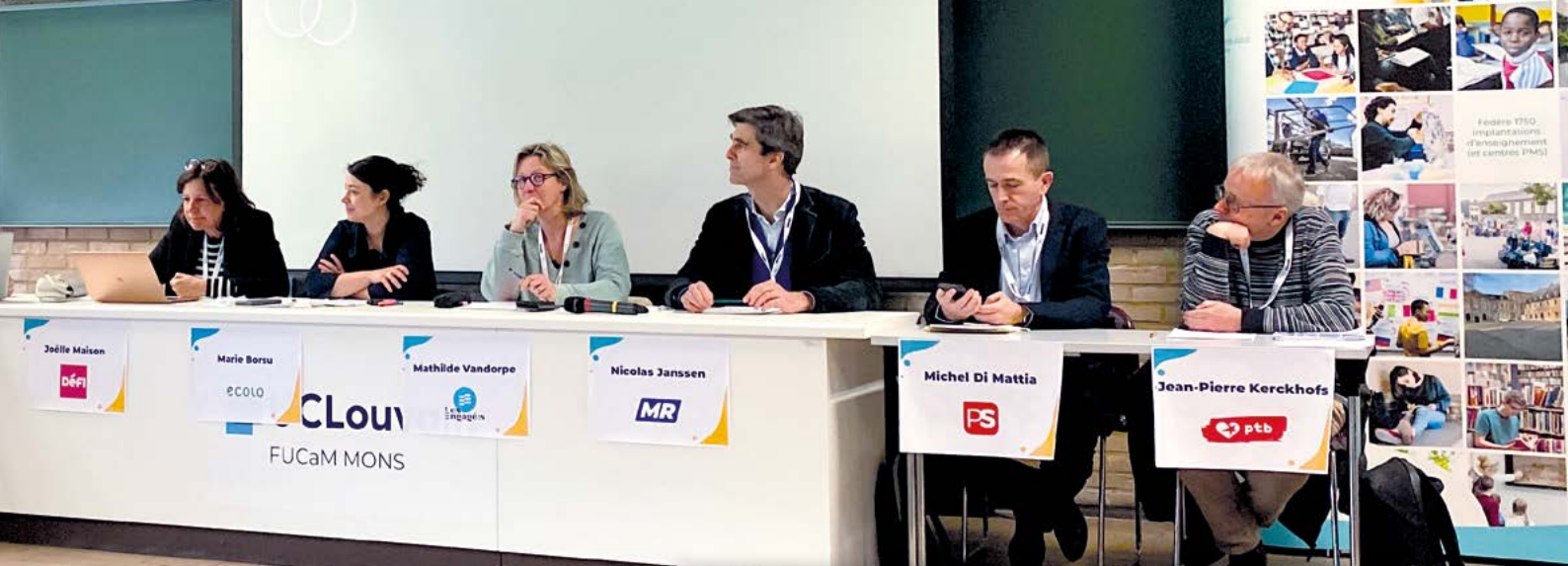
Les représentants des partis lors de la journée d'étude du SeGEC