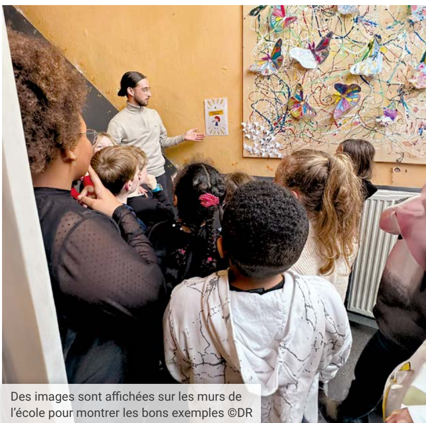
Des images sont affichées sur les murs de l'école pour montrer les bons exemples

Cette approche porte ses fruits mais quelques adaptations sont à prévoir. « Pour relancer le projet l'année prochaine, on a en perspective de faire des petites capsules vidéo pour qu'il y ait une piqûre de rappel en début d'année. Tous ces changements auront également une incidence sur le ROI de l'école, c'est aussi à prendre en compte », conclut Delphine Golinvaux. ■