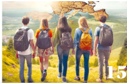
Préparer les jeunes au vote électoral