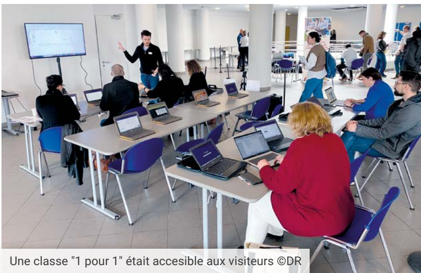
Une classe "1 pour 1" était accessible aux visiteurs

« On vous donne déjà rendez-vous l'année prochaine pour une 3 e édition de la journée du Virage Numérique qui sera probablement centrée sur la FMTTN (Formation Manuelle, Technique, Technologique et Numérique) et un maximum d'exemples concrets, pour accompagner au mieux les enseignants dans la mise en place progressive du tronc commun qui se déploiera dès l'année scolaire 2026-2027 en première secondaire », conclut Josette-Marie Houben. ■