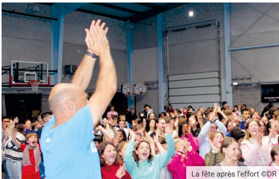
La fête après l'effort