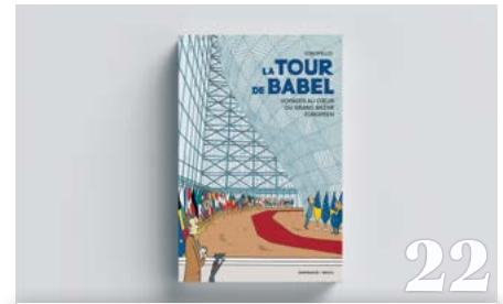
Concours : La tour de Babel