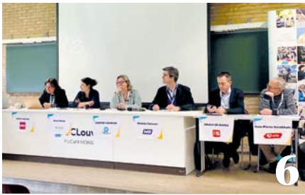
Les priorités des partis politiques