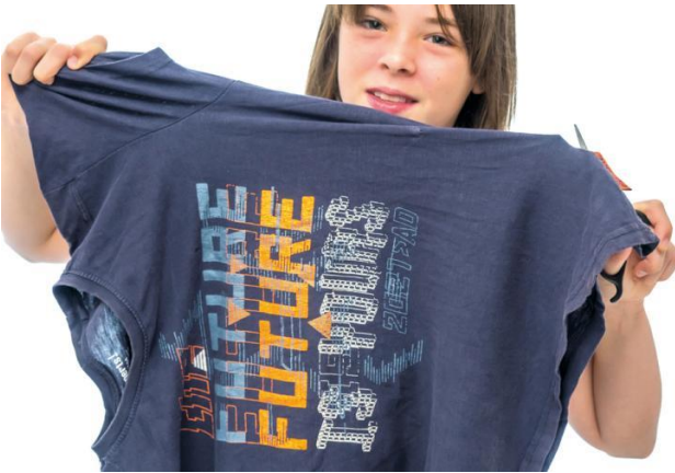
Personnaliser et recycler des vieux tee-shirts