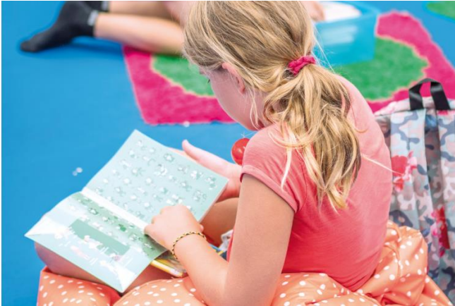
12 activités pour entrer dans le livre