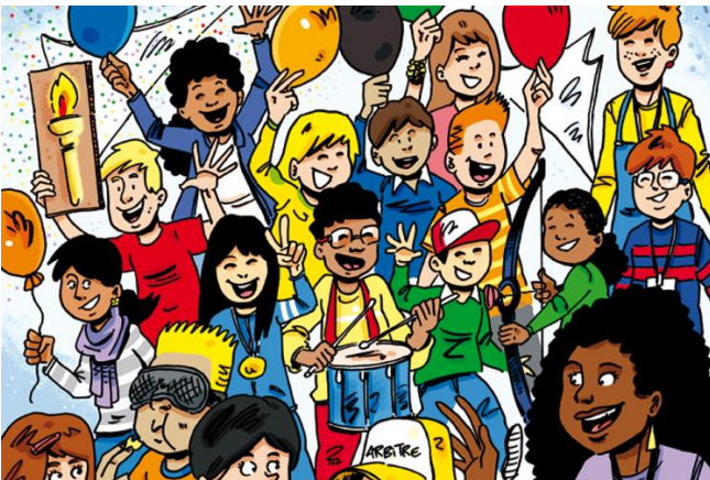
Grand jeu de l'été : faites vos Jeux !