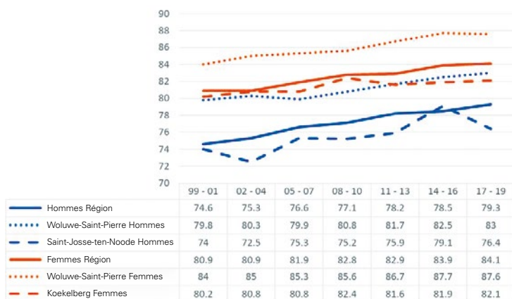
Schéma n°1: Espérance de vie à la naissance selon le sexe et la période, Région bruxelloise, 1999-2019

Source: Observatoire de la Santé et du Social, Bulletins statistiques de naissance et décès & Statistics Belgium