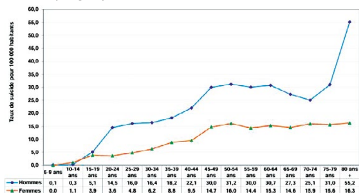
Schéma n°3: Taux brut de mortalité par suicide parmi les Bruxellois, par âge et par sexe, années 2001-2021

Au cours des 20 dernières années, le taux de mortalité standardisé par suicide a diminué de plus de la moitié passant de 22,5 décès pour 100 000 habitants en 1998 à 9,5 en 2021. Toutefois, la mortalité par suicide (taux brut de mortalité) augmente avec l'âge, chez les hommes et les femmes, mais de manière plus marquée chez les hommes, chez qui on observe par ailleurs une augmentation importante à partir de 75 ans, comme le montre le schéma ci-dessous.