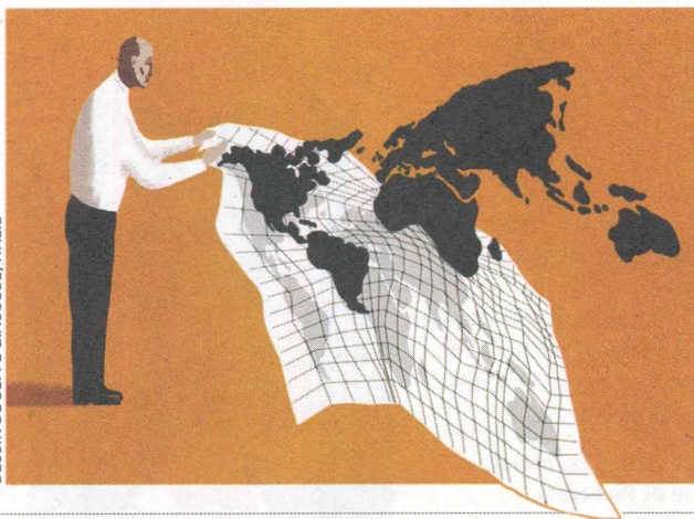
DESSIN DE BEPPE GIACOBBE, ITALIE

Citoyens, dirigeants et économistes sont de plus en plus nombreux à dénoncer les méfaits du libre-échange, en particulier pour les classes moyennes, explique Quartz . La revue Foreign Affairs analyse de son côté les craintes suscitées par le futur traité transatlantique.