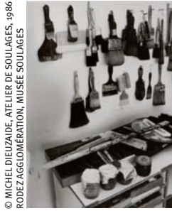
© MICHEL DIEUZAIDE, ATELIER DE SOULAGES, 1986 RODEZ AGGLOMÉRATION, MUSÉE SOULAGES