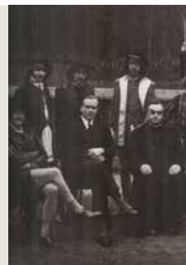
Théâtre au Collège Saint-Servais de Liège, vers 1900

“ Rendre compte des activités parascolaires à l'intérieur ou autour de l'école catholique pendant environ deux siècles peut ressembler à un « inventaire à la Prévert », puisque dans le temps et dans l'espace extra-scolaires, on pourrait aligner tournois d'éloquence, réunions, camps et hikes de scouts, recollections dans une abbaye, pèlerinages annuels à Notre-Dame-au-Bois, kermesses aux boudins, séances de ciné-forums, matches de football ou comédies de Labiche et de Courteline. Le relevé qu'on peut en donner ne saurait être complet. Au cœur du système éducatif catholique, les programmes d'activités parascolaires reflètent les évolutions importantes de la société belge et les profonds changements pour l'Église entre 1830 et aujourd'hui : deux guerres mondiales, des polarisations politiques et des conflits sociaux, des fossés générationnels et la sécularisation de l'Église catholique, suivie de la lente « dépillarisation » de la société