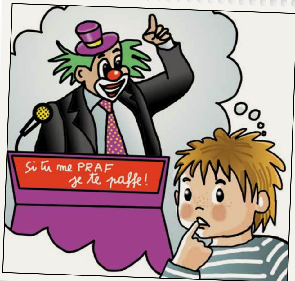
Illustration : Anne HOOGSTOEL

Et si réellement, certains finissaient par s'en fiche de tout, s'en fiche non seulement de la politique, de l'intérêt général, mais aussi de l'autre, de son collègue, de son voisin... ? À quoi bon ? Dieu sait