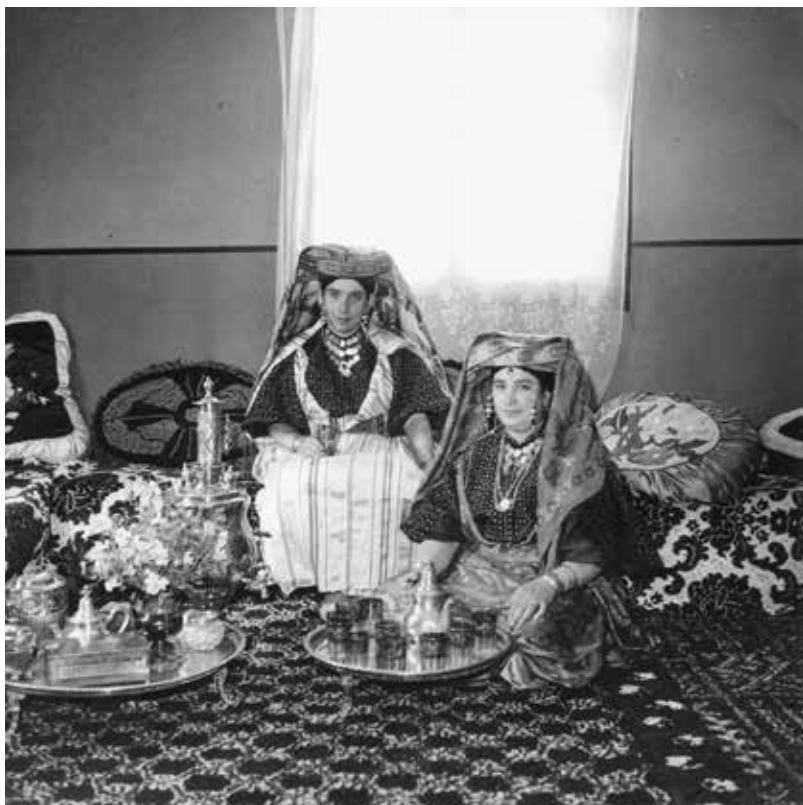
Les deux femmes légitimes

Voici trois ans, le Musée Juif de Belgique (Bruxelles) était la cible d'un attentat. Depuis, il poursuit inlassablement ses activités et propose notamment des activités pédagogiques destinées aux écoles primaires, secondaires et supérieures, ainsi qu'aux familles.