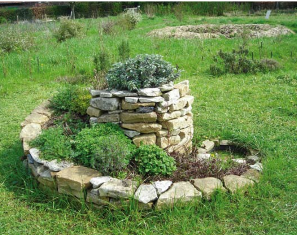
Spirale d'aromatiques offrant différents habitats pour insectes et petits animaux.

leurs usages en cuisine et en santé, le tout sans pesticide évidemment !