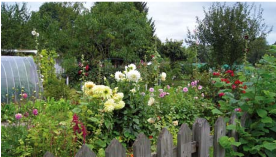
Potager collectif à Anderlecht

A la suite du développement durable, le concept s'est étendu à d'autres domaines comme ceux du logement, de l'économie, de la finance ou du tourisme. Le souci de « répondre aux besoins du présent sans compromettre la capacité des générations futures de répondre aux leurs 1 » est devenu un véritable enjeu de société. Cela n'étonnera guère que l'alimentation se soit également engagée de façon concrète dans cette démarche. Les nombreuses initiatives pour manger de manière plus saine et durable témoignent de cette préoccupation. Toutefois, parler de l'alimentation durable ne peut se faire sans évoquer la question d'une agriculture alternative, notamment celle de l'agriculture urbaine. Où en est-on vis-à-vis de ces démarches au niveau de la Région bruxelloise ?