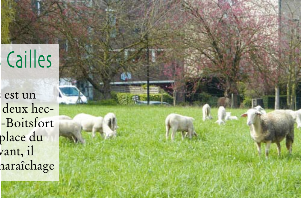
Les brebis de la Ferme du Chant des Cailles

La Ferme du Chant des Cailles est un projet d'agriculture urbaine de deux hectares et demi situé à Watermael-Boitsfort entre l'avenue des Cailles et la place du Colibri. Particulièrement innovant, il mêle participation citoyenne, maraîchage et élevage de moutons !