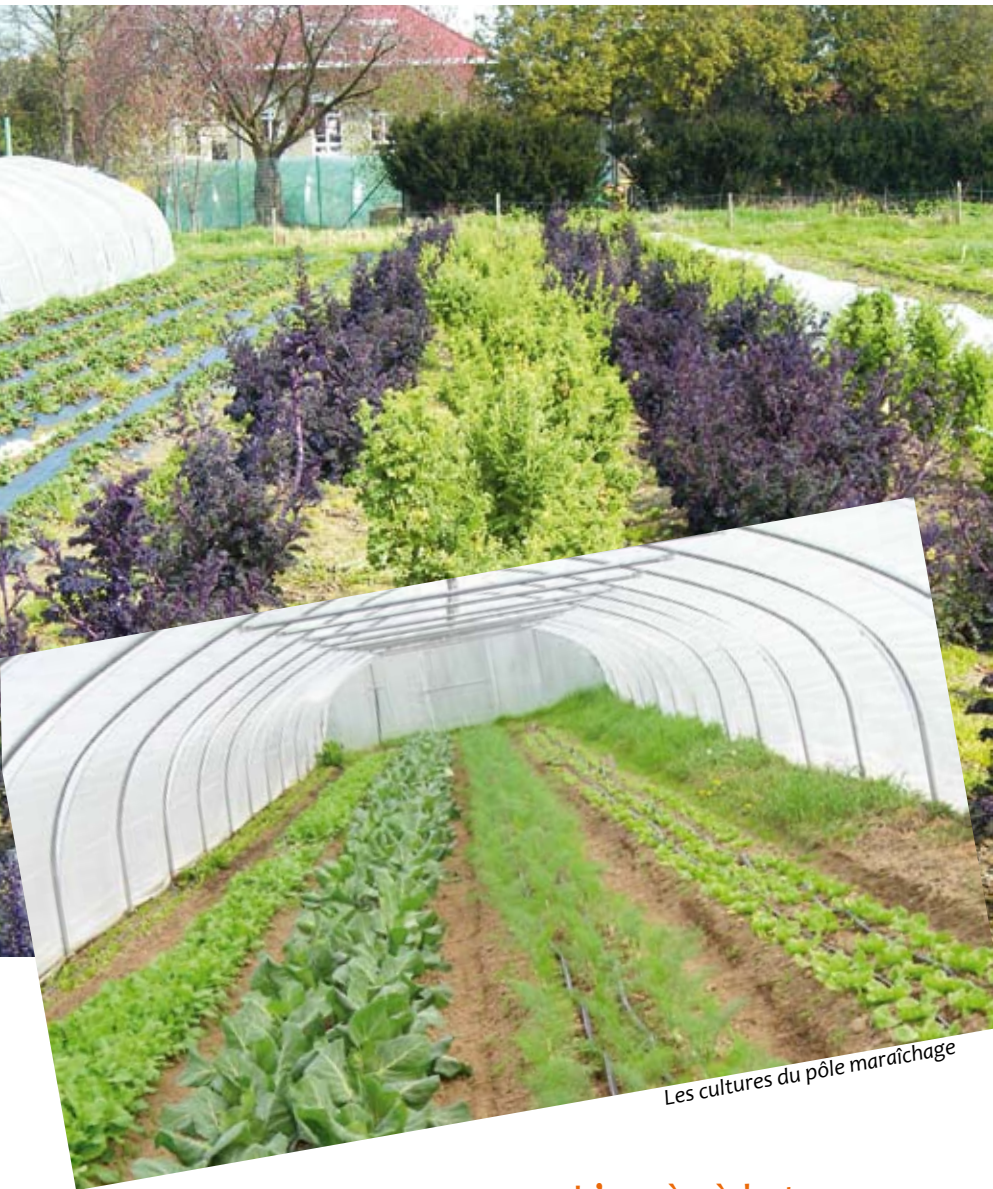
Les cultures du pôle maraîchage

cidé que les futurs logements ne dépasseraient pas un tiers du terrain car ils ont estimé que la Ferme du Chant des Cailles enrichissait fortement le quartier. Ce soutien est important pour nous, il nous permet d'avoir l'énergie de continuer le projet malgré la précarité de notre situation. »