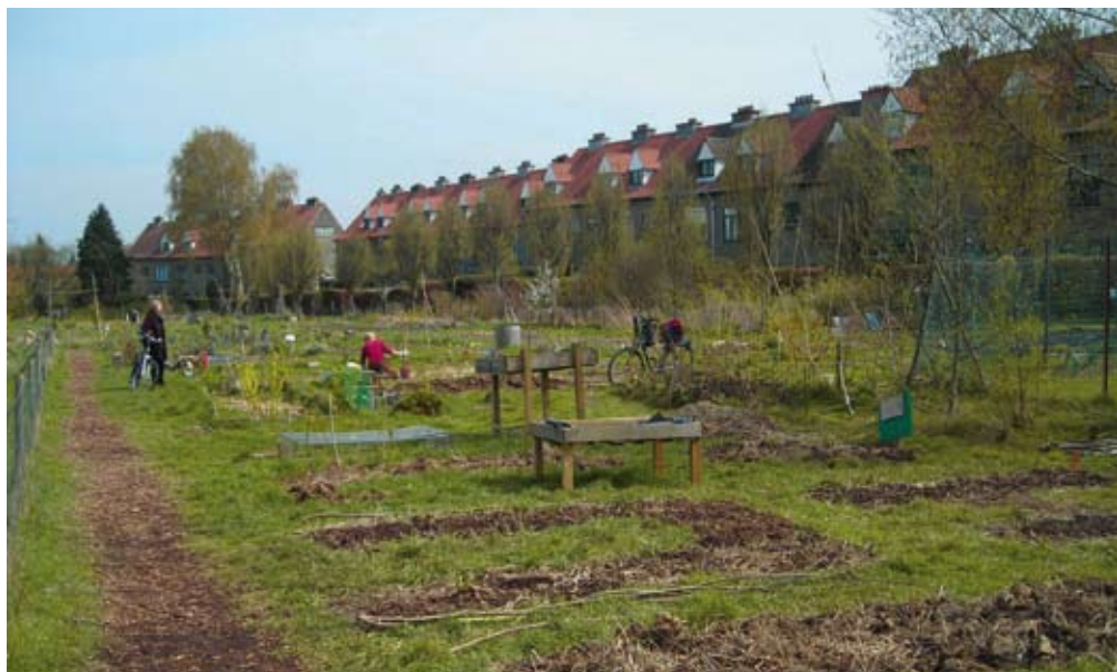
Le potager collectif de la Ferme du Chant des Cailles

Mais, très rapidement, les activités des différents pôles ont pris de l'ampleur, et le succès a été inattendu. Pourtant, l'annonce de la construction des logements est arrivée plus vite que prévu : « Très vite nous avons reçu beaucoup de soutien des membres, des habitants mais aussi de la Commune et du Logis, qui ont dé-