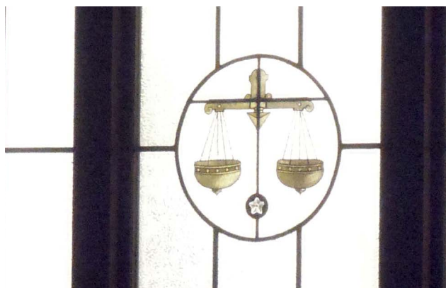
Le credo d'Arpège-Prélude : punir autrement.

Ces questions, le service « Arpège-Prélude » se les pose régulièrement. Leur credo : « punir