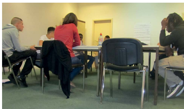
La formation : une sanction qui va être exécutée, qui a du sens et en lien avec le délit.

atteint son but ? Comment travailler à des alternatives avec l'impression vive que l'on avance contre le vent ?