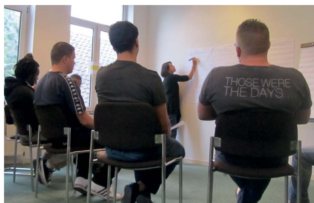
Participants en formation

Se mettre à la place de l'autre. S'extirper de sa propre colère et, parfois, de son propre aveu-gement, pour tenter de comprendre ce qu'une victime peut ressentir. Voilà bien un exercice délicat. Il clôt la formation.