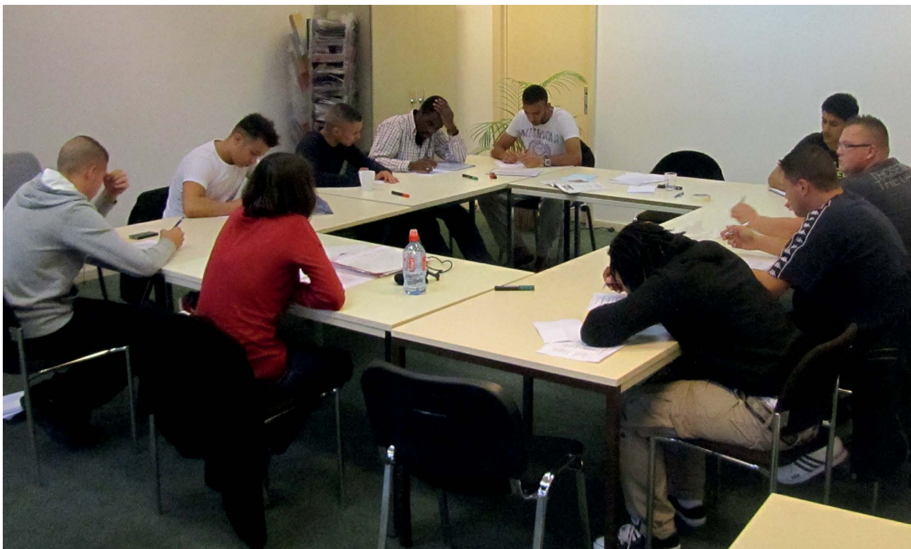
Pendant la formation, la parole des participants est libre.

des participants regardent leur acte d'une autre manière. Certains arrivent à changer la perception qu'ils ont de leur fonctionnement. S'ils réagissent sans violence, s'ils se disent que pour défendre leur honneur, il y a d'autres possibilités, c'est déjà l'amorce d'un changement ».