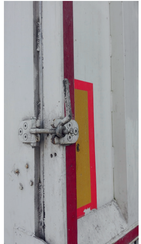
Verrouillage hayon de chargement arrière : - photo de gauche : verrouillage actionné pneumatiquement ou hydrauliquement - photo de droite : verrouillage manuel