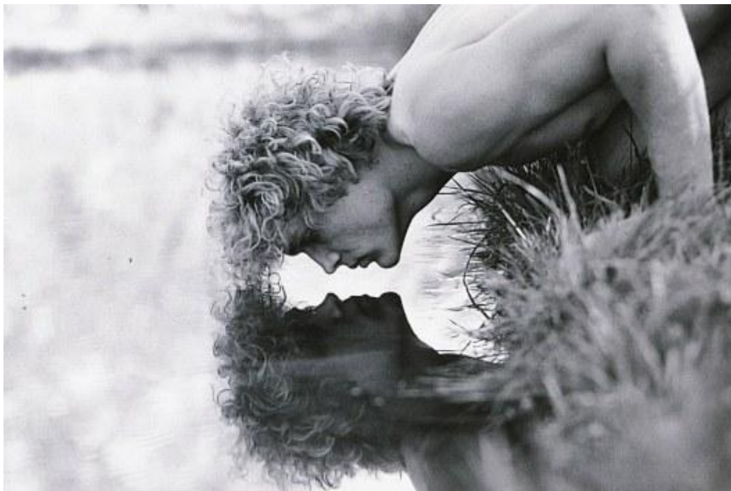
Duane Michals, Narcisse , Galerie Pace Mac Gill, New-York © Duane Michals, Courtesy Pace / MacGil Gallery, New-York.