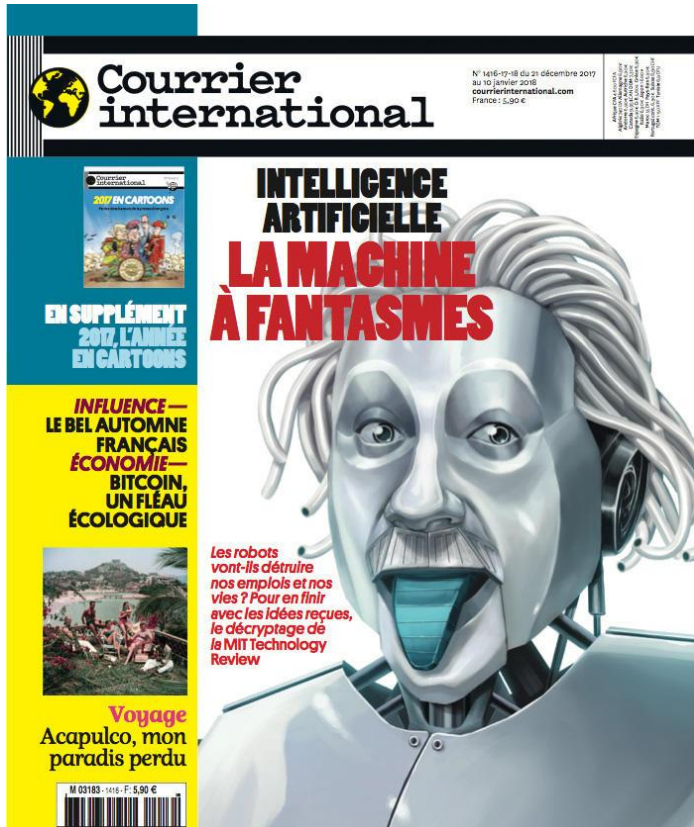
Illustration de Miriam Migliazzi & Mart Klein parue dans Handelsblatt, Düsseldorf

Intelligence artificielle : la machine à fantômes