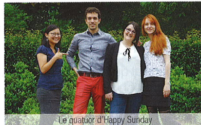
Le quatuor d'Happy Sunday

Parce que le monde d'aujourd'hui ne se conçoit plus sans la toile, nos entrepreneurs de ce mois ont fait le pari d'y développer leur business partiellement, voire exclusivement. Certains d'entre eux n'ont en effet joué que la combinaison « 3W » pour propulser leurs activités dans l'événementiel... ou le béton !