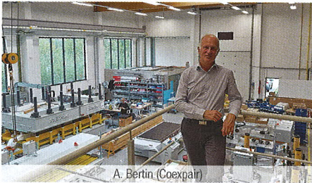
A. Bertin (Coexpair)

En 10 ans, Coexpair est devenue leader mondial dans les technologies de fabrication de matériaux composites pour l'aéronautique. Elle a récemment inauguré ses nouvelles installations dans le parc Ecolys.