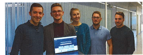
La jeune équipe de Localisy