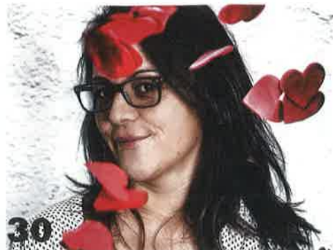
30 Polyamorrie: veel singles en koppels zijn er al bedreven in, anderen flirten met het idee: leven met twee of meer geliefden.